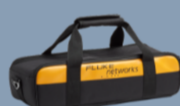
Borsone morbido da trasporto per kit micro IT MICRO-DIT Fluke Networks