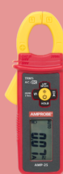
Mini pinza Beha-Amprobe AMP-25