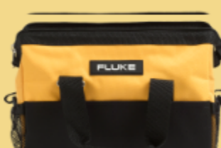
Borsa per attrezzi Fluke C550