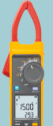
Multimetro a pinza elettrosolare Fluke 393 FC CAT III 1500 V