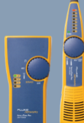
Fluke Networks MT-8200-60-KIT