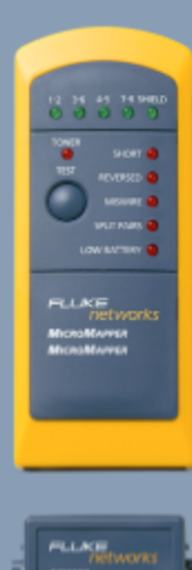
Fluke Networks MT8200-49A