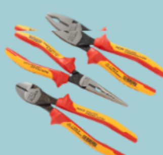
IKPL3 - Kit di 3 pinze isolate, 1000 V (applicazioni solari)