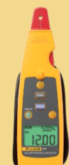
Multimetro a pinza per controllo di processo milliamper Fluke 771