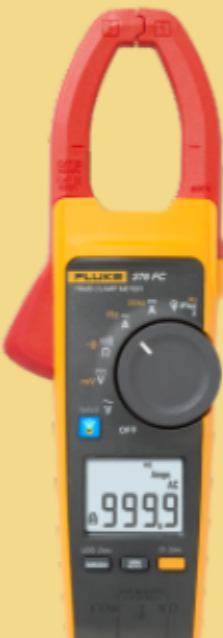
Multimetri a pinza CA/CC con registrazione wireless Fluke 376 FC