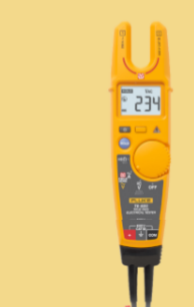
Tester elettrico Fluke T6-1000 PRO