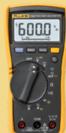
Multimetro digitale Fluke 115