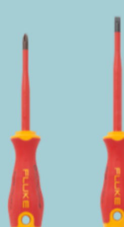
Kit di cacciaviti Fluke (ISL58 o IPHS2)* (per applicazioni solari)