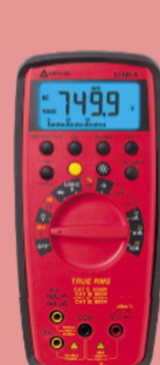
Multimetro digitale a vero valore RMS Beha-Amprobe 37XR-A