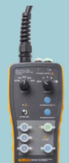
Fluke FEV-300 (EV)