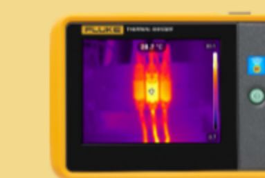
Termocamera tascabile Fluke PT120