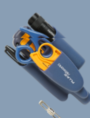
Pro-Tool Kit IS60 Fluke Networks