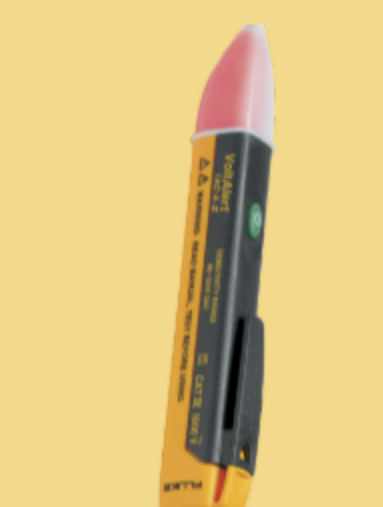
Tester di tensione senza contatto Fluke 1AC II