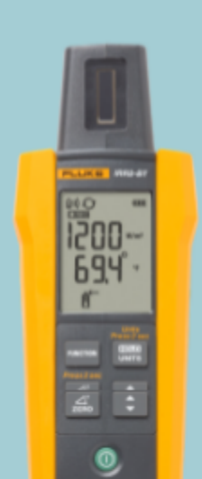
Misuratore di irraggiamento Fluke IRR2-BT (applicazioni solari)