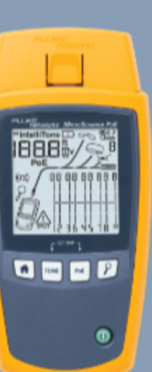
Fluke Networks MS-POE