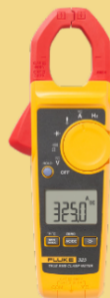
Multimetro a pinza a vero valore RMS Fluke 325