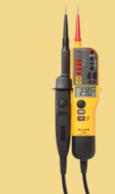
Tester di tensione e continuità bipolare Fluke T130