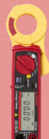
Multimetro a pinza per correnti di dispersione Beha-Amprobe AC50A-D