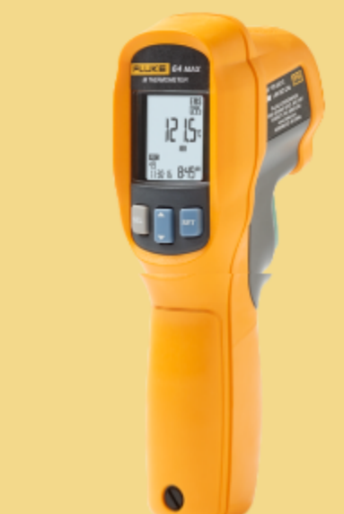
Termometro a infrarossi Fluke 64 MAX