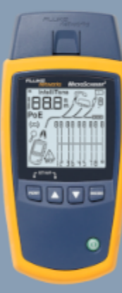
Fluke Networks MS2-100