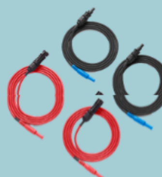
Fluke TL1000-MC4 (applicazioni solari)